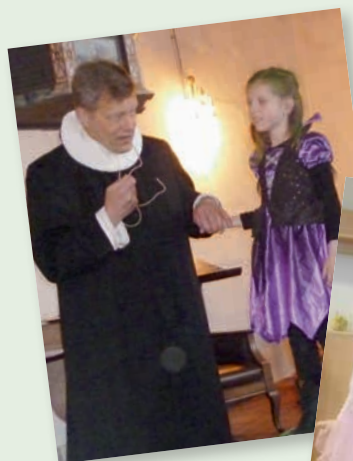
Billeder fra familie- og fastelavnsgudstjeneste d. 11. februar i Hanning kirke og tøndeslagning på Tingager.